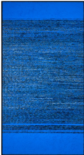
Ohne Titel Kobaltpigment/Acryl auf HDF jeweils 146 x 78 cm

Regierungspräsidium Freiburg - Regierungspräsidium Tübingen - Kunstsammlung des Bodenseekreises Sparkasse Überlingen - Sparkasse Karlsruhe - Stadt Weingarten - Sammlung des Zeppelinmuseums der Stadt Friedrichshafen - Sammlung der Stadt Waldshut-Tiengen - Sammlung Gerhard Hartmann - Kunstsammlung des Landkreises Konstanz